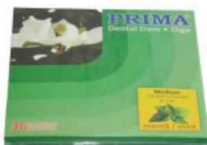
Digă latex nepudrată mentolată