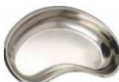
Tăviță renală inox