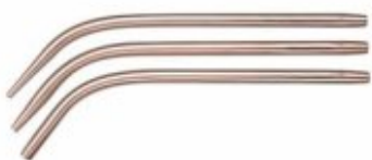
Aspirator chirurgical metalic