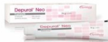
Pastă periaj Depural Neo Spofa