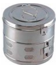
Casoletă sterilizare cu capac, inox