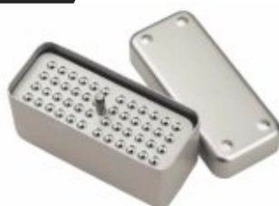
Cutie sterilizare ace