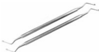
Chiuretă alveolară Lucas, tip excavator