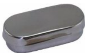
Cutie freze și ace