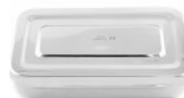
Cutie instrumentar INOX