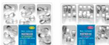
Matrici conturate cu mâner de fixare