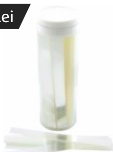
Bandă matrice celuloid