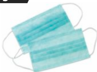
Măști medicale 3 straturi