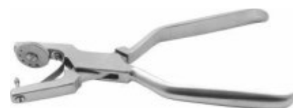
Clește perforator digă inox