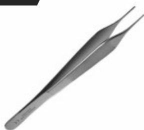
Pensă microchirurgie dreaptă