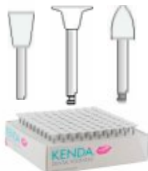
Gume polizare Abrazive KENDA