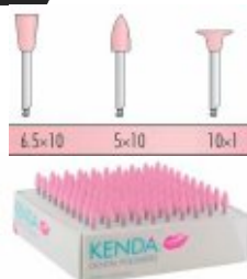
Gume polizare Ultra-Fine KENDA