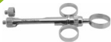
Seringă pentru anestezie oțel inox