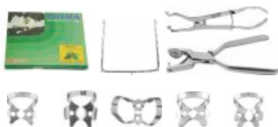
Sistem de DIGĂ set complet