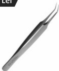
Pensă microchirurgie curbă