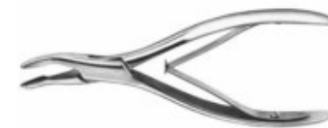
Clește ciupitor de os