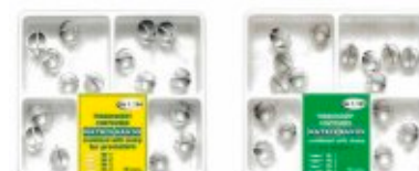
Matrici conturate Mylar