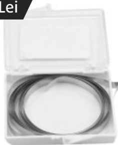
Rolă inox matrice