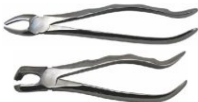
Clește extracții dentare

Disponibili pentru arcada superioară și inferioară.