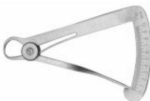
Instrument măsurat metalul Iwanson