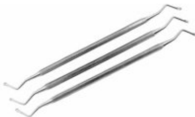
Chiuretă alveolară Hemingway, tip Linguriță