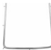
Ramă digă inox