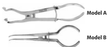
Clește aplicator cleme digă inox