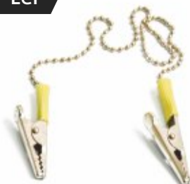
Lanț metalic pentru bavete 42cm