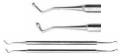
Fulgar de compozit sferic/romboidal