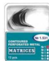
Matrici Ivory conturate perforate